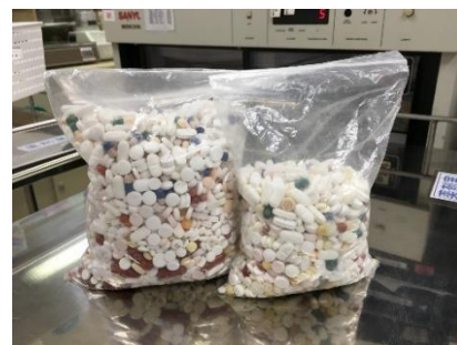
【当院に持ち込まれた残薬の一部】