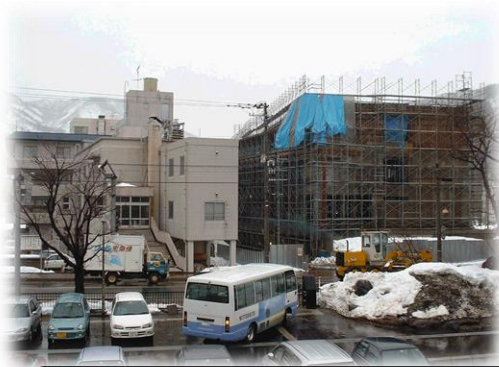
平成 13 年 冬 建設中の医療センター