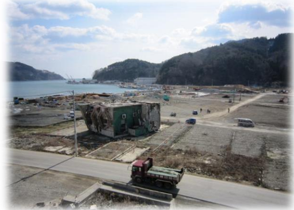
【平成 26 年 3 月】