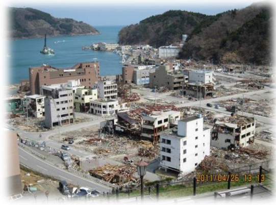
【平成 23 年 4 月】