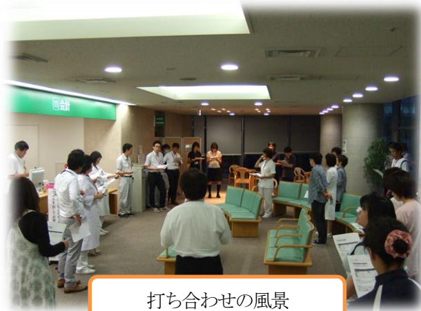
打ち合わせの風景