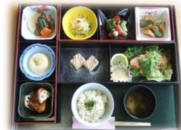
（4月からは新メニューです）

検査にかかる時間は約半日で、検査後には併設されているプールや温泉、マッサージ機がご利用いただけます。（新型コロナウイルス感染症の状況によっては、ご利用いただけない場合もあります。）また、お食事のご用意もありますので、ぜひ一度ご賞味ください。